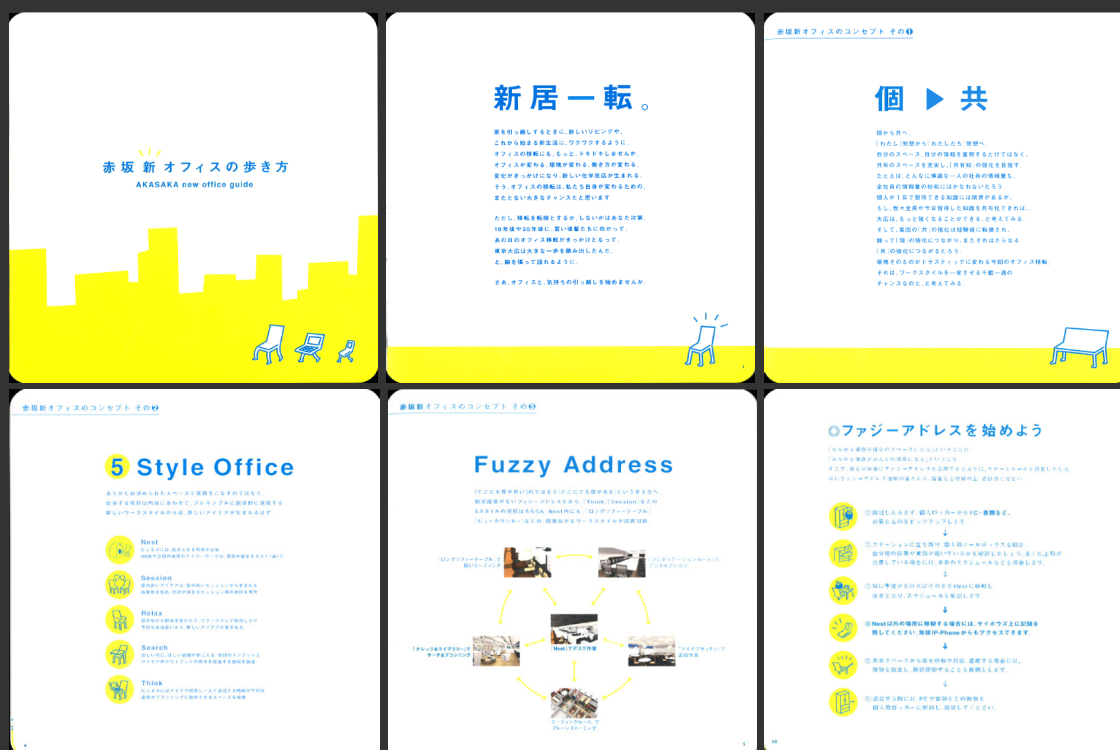
移転直前に社員に配布された移転マニュアル