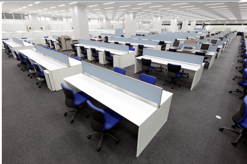
ユニバーサルレイアウトを導入したオフィス