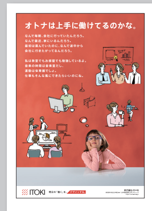
表2(表紙の裏) 1 ページ例