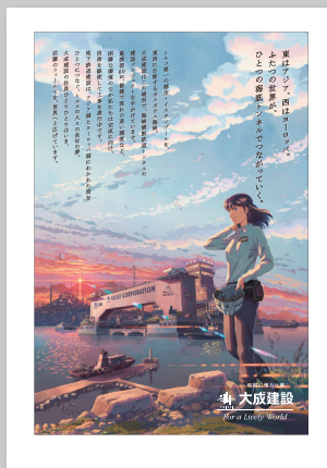
表3(裏表紙の裏) 1 ページ例