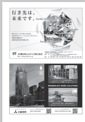
本文 1/2 ページ例