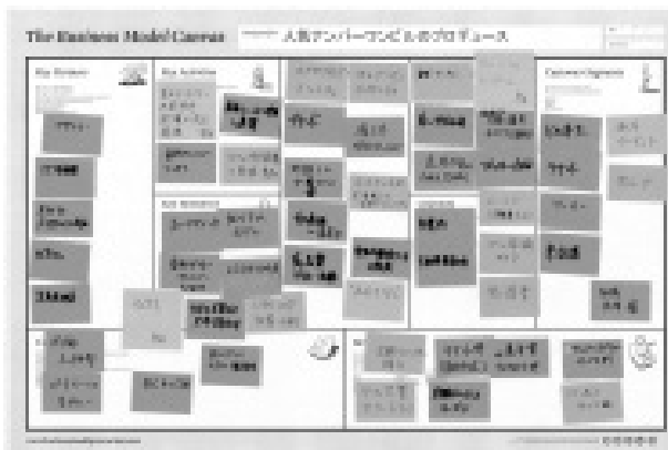
図表 3 ビジネスモデルキャンパスの例

ビジネスモデルの構築という目標についても、ガイドブックでその一端を披露した。7 章で「FM 領域における新しいビジネスのありかた」を提案している。