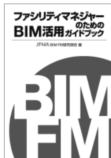
図表1 ファシリティマネジャーのために BIM 活用ガイドブック

7章「BIMを活用したビジネスモデル」では、BIMを活用した新たなビジネスモデルを提案している。BIMそのものや建物情報を利用することの可能性を感じていただける内容となっている。