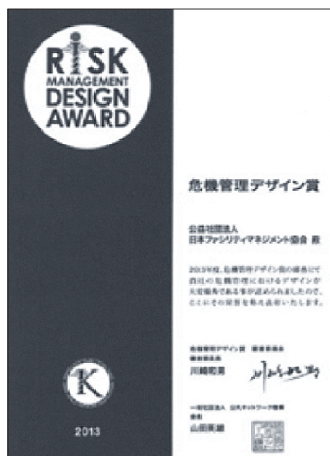
2013年 公共ネットワーク機構 第1回危機管理デザイン賞 「病院BCPを支援するFMツール (病院機能診断ツール)」