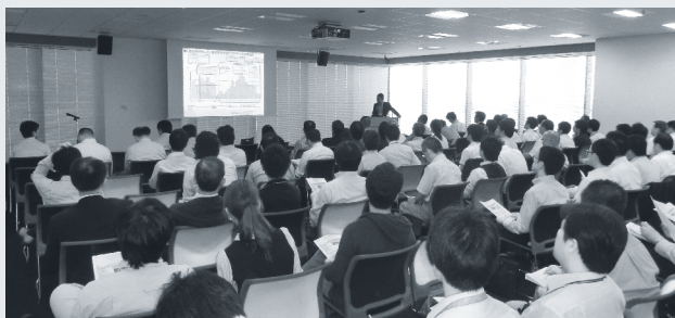
公共FMスクール in 大阪