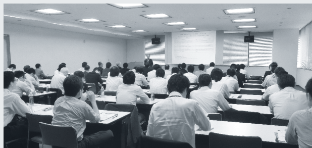
公共FMスクール in 福岡