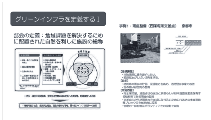
図表1 部会で定義したグリーンインフラ

今後は彼らとのセッションによって得られた、いくつかの素朴な疑問や問題提起を受けて来年度につながる活動としていきたい。◀